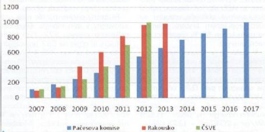
Graf 1 – Očekávaný vývoj instalovaného výkonu VE v ČR a porovnání s vývojem v Rakousku v letech 2001 – 2007 (dosažení 1000 MW)

Poznámka: Instalovaný výkon VE v ČR byl na konci roku 2007 113 MW